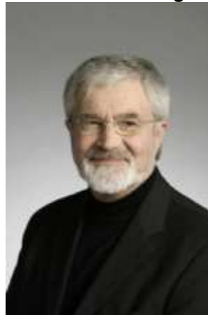
Næstformand i beretningsperioden Regionsrådsmedlem Skolepsykolog